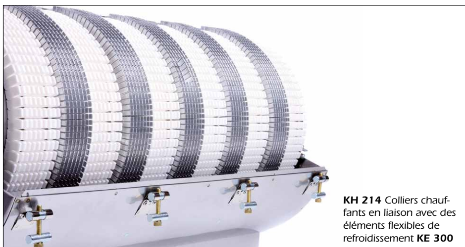
KH 214 Colliers chauffants en liaison avec des éléments flexibles de refroidissement KE 300

Complet avec capot en tant que combinaison chauffe/refroidissement HK 214 livrable.